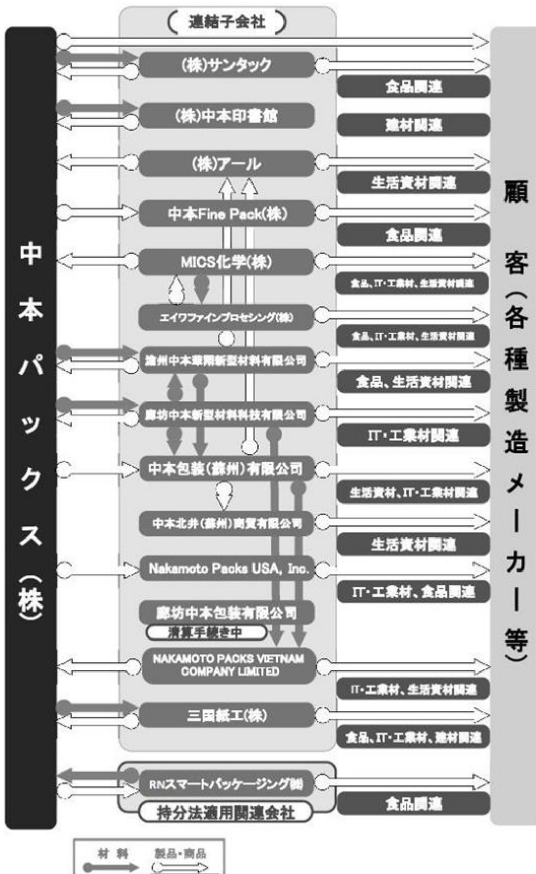
[ 事業系統図 ]