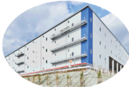
物流施設開発事業 (例：箕面ロジスティクスセンター)