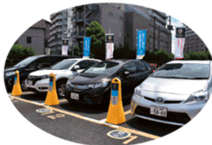
カーシェアリング事業 (例：オリックスカーシェア)

また、1971年の香港進出を皮切りに世界28カ国・地域に拠点を設け（2023年3月末時点）、グローバルに活動しています。