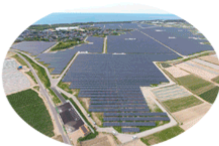
メガソーラー発電事業 (例：新潟県四ツ郷屋発電所)