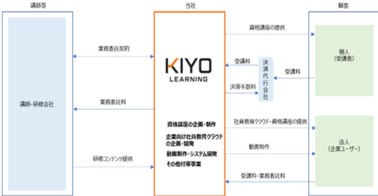
[ 事業系統図 ]

上記のように当社は、従来のオンライン教育サービス（eラーニング）の枠に捕らわれず、個人向けのキャリア開発を目的とした学習関連サービスや、企業向けの人材育成に関連したサービスを拡充していくことにより、キャリア開発に関連した教育の事業分野をリードし、事業拡大と企業価値向上に邁進してまいります。