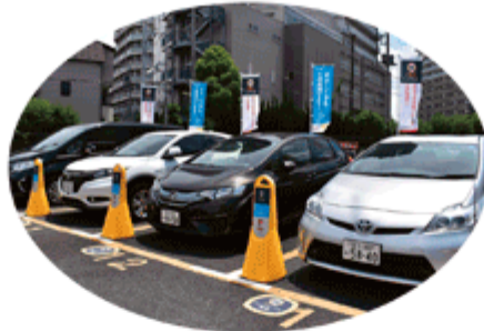
カーシェアリング事業 (例：オリックスカーシェア)