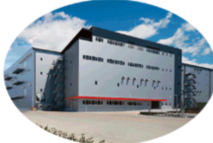
物流施設開発事業 (例：松伏ロジスティクスセンター)