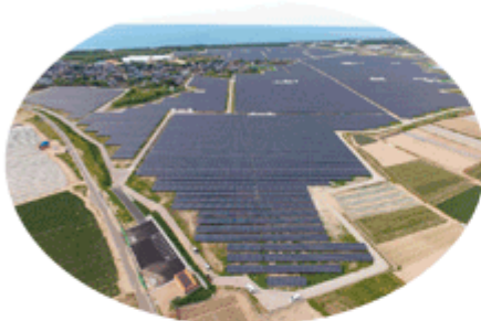
メガソーラー発電事業 (例：新潟県四ツ郷屋発電所)