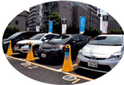
カーシェアリング事業 (例：オリックスカーシェア)