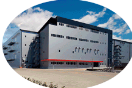
物流施設開発事業 (例：松伏ロジスティクスセンター)