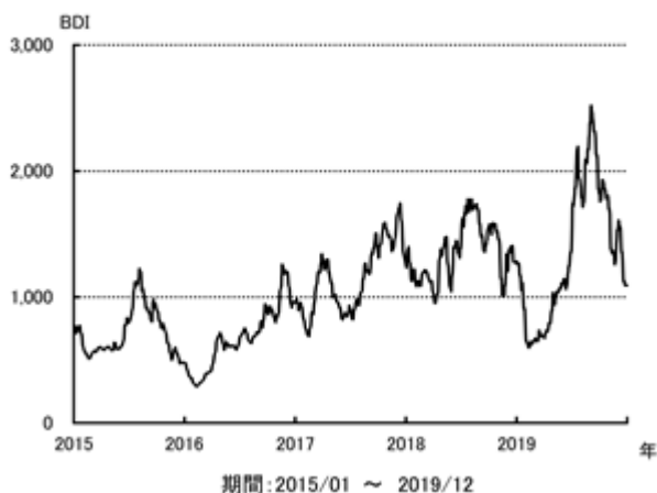
不定期船市況 BDI の推移