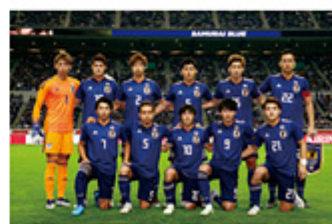
2018年10月16日対ウルグアイ戦 先発メンバーC.F.A