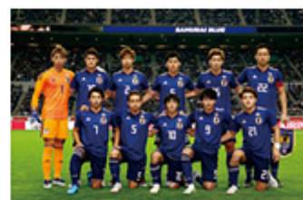
2018年10月16日対コロンビア戦 先発メンバー-CJFA