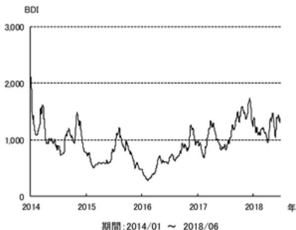
不定期船市況 BDI の推移