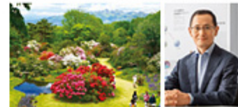
赤城自然園「春の開園」2017年3月31日(日)～