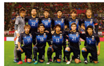
キリンチャレンジカップ2016 男子代表選手 先見メンバー(2016.11.11)