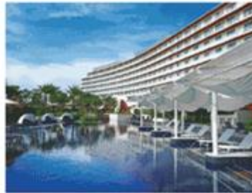
不動産事業部門 施設運営事業「ヒルトン沖縄北谷リゾート」