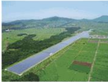
事業投資事業部門 国産エネルギー関連事業 メガソーラー発電事業（鹿児島県枕崎町）