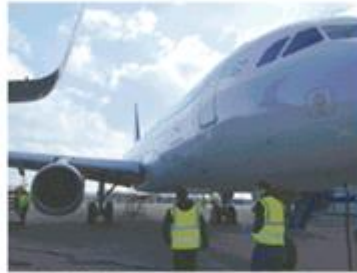
海外事業部門 航空機関連事業