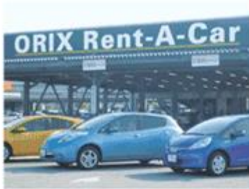
メンテナンスリース事業部門 オリックス自動車のレンタカー事業