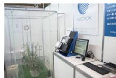
第1回国際次世代農業EXPO(通称アグリネクスト)の出展ブース

7月には、農業ICTを活用した施設栽培における病気予防策に関して、岩手大学との共同研究を開始いたしました。施設栽培における最も大きな課題の一つである病気の発生を抑えるために、静電気を利用したカビ胞子の捕集・静電気により発生するイオンを用いたカビ胞子の不活性化の実証実験を行います。ICTシステムにこれらの装置を組み込み制御することで施設内のカビの防除を行うだけでなく、実証試験による研究データの集積により病気発生予測を行い、事前に環境を制御することで、低コストで病気抑制を実現できる施設栽培システムの構築を目指しております。10月には、第1回国際次世代農業EXPO(通称アグリネクスト)に株式会社ネクスの農業ICTシステムの製品を出展いたしました。