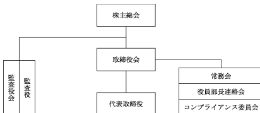
会社の機関の概要

なお、当行は、社外取締役については選任しておりませんが、各取締役間における経営監督機能が果たされているほか、財務・会計、法令、企業統治等についての専門的な知見を有し、公正・独立な立場で業務執行の妥当性等を監視する社外監査役3名を含め、5名の監査役により、客観性及び中立性のある経営監視機能を確保していることから、現状の体制によって各機能は十分に機能しております。